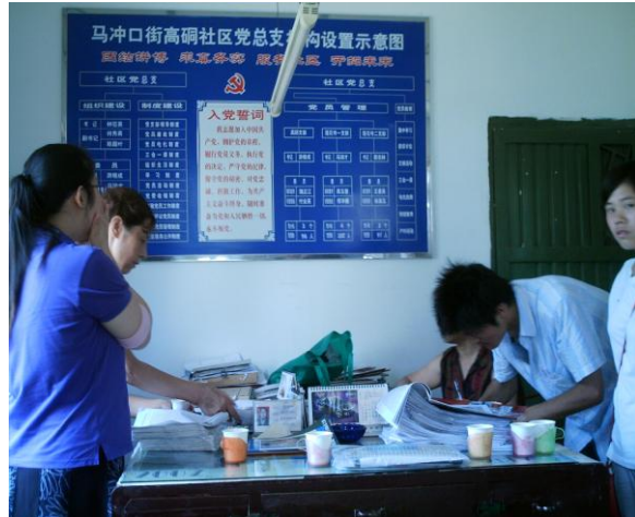
队员在马冲口高硐社区调查

(在后期也有个别的调查工作)。首先调查的是自流井区，从市残联处获得贡井区和大安区两区残联的联系方式，然后调查大安区和贡井区，11日上午，全体队员在汇东108室召开会议，对前期调查的残疾朋友进行筛选分类。根据筛选的结果，团队具体分出了就业组，水果摊组，手工艺等功能组，接下来便是各组分头开展具体的帮扶工作。