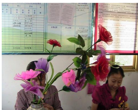
看两位残疾朋友正学得起劲呢