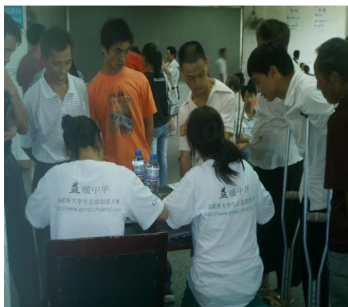
残疾朋友有序登记

8月7日就业双选会顺利举办。就业组的工作也是从7月12日开始的，这其中主要的工作就是联系企业，通知残疾朋友，现场布置等。由于时间是订在8月7日，所以这其中很多时候就业组的同学参与到其他小组的工作中。8月7日双选会顺利举办，当天我们派去了5名队员，一是现场登记，二是持续维护。据当天的情况来看，初步达成工作意向的45个，但是最终确定的确仅3个。所以双选