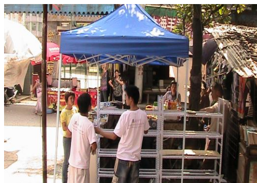
崭新的雨篷和书架