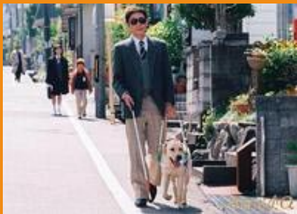
◀ 图为一条训练有素的导盲犬会引领主人穿梭在繁忙的人流和街道