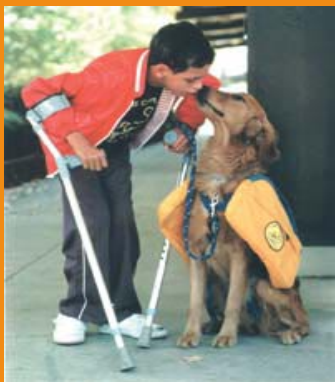
◀ 图为人和导盲犬和谐相处的情景